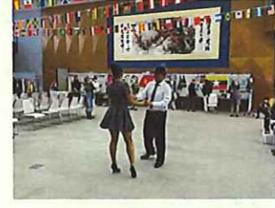
(アルゼンチンタンゴ)