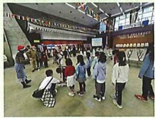
(皆でゲーム(ベトナム))