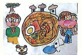
審査員長賞(最優秀賞)