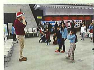
(皆でゲーム(イギリス))